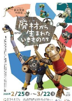
①メインビジュアル