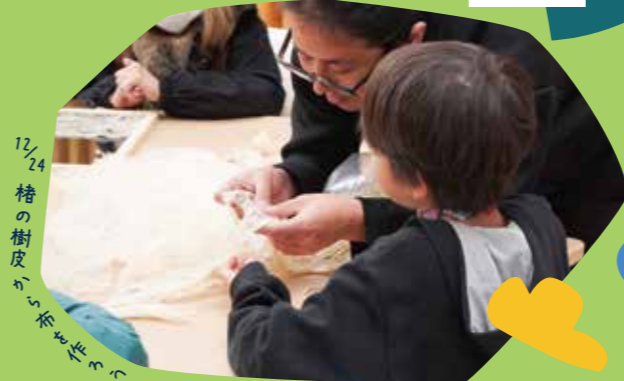
12/24 檜の樹皮から染め紙を作ろう