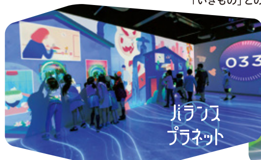
バランス プラネット

壁全面を使った大型映像で、都市と自然の「バランス」や「いきもの」とのふれあいを体験してみよう!