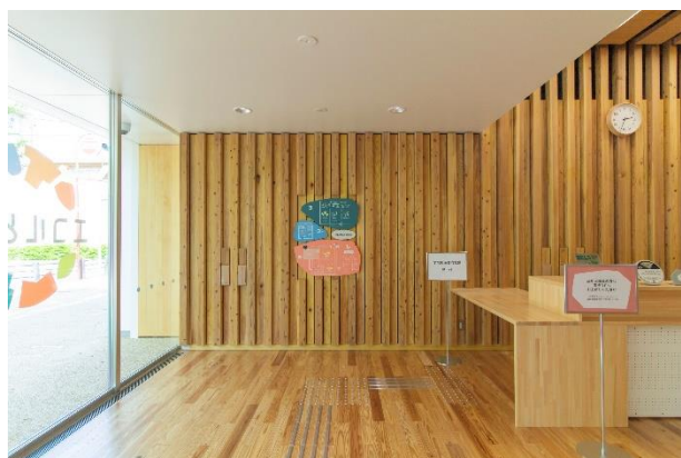
▲会場となるコミュニティラウンジ(左)・エントランス(右)